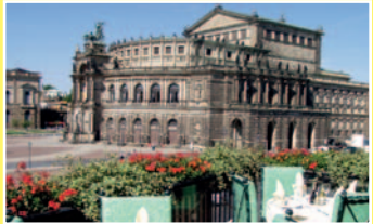
Blick zur Semperoper